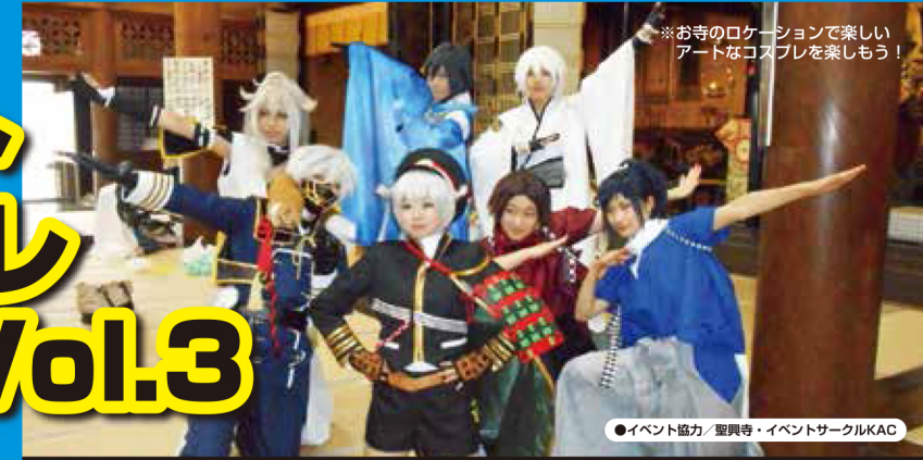
※お寺のロケーションで楽しいアートなコスプレを楽しもう!